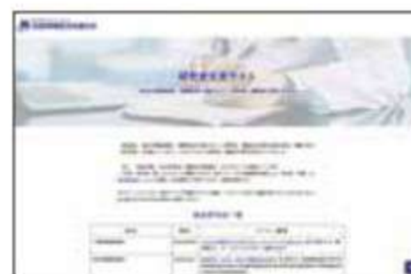
保団連 研究交流サイト

https://hodanren.doc-net.or.jp/kenkyu/index.html