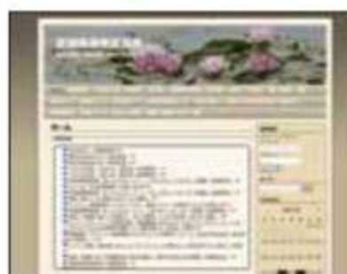
宮城県保険医協会Webサイト

また、保団連「研究会交流サイト」では、他県の保険医協会が主催するWeb学習会の一覧が確認できます。(参加するには保険医協会への入会が必要です。)